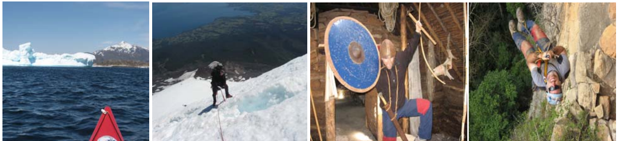
Photo-conférence dans des lieux inédits adaptée spécialement aux étudiants du secondaire avec des côtés portant sur la motivation, soit de vivre à fond ses rêves tout en gardant les pieds sur Terre, et d'ouverture sur le monde.